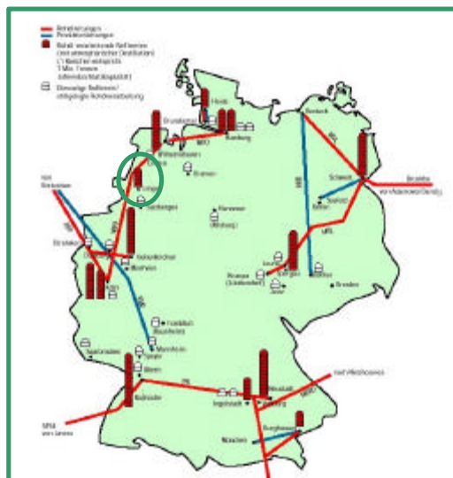
Abb. 2: Standort in Deutschland

Die Raffinerie wurde standortnah zur Verarbeitung des schweren deutschen Rohöls des Emslandes erbaut und 1953 in Betrieb gestellt. Mit dem Anschluss an die NWO-Pipeline 1958 wurde ein weiterer Verarbeitungsstrang für das Importrohöl errichtet.