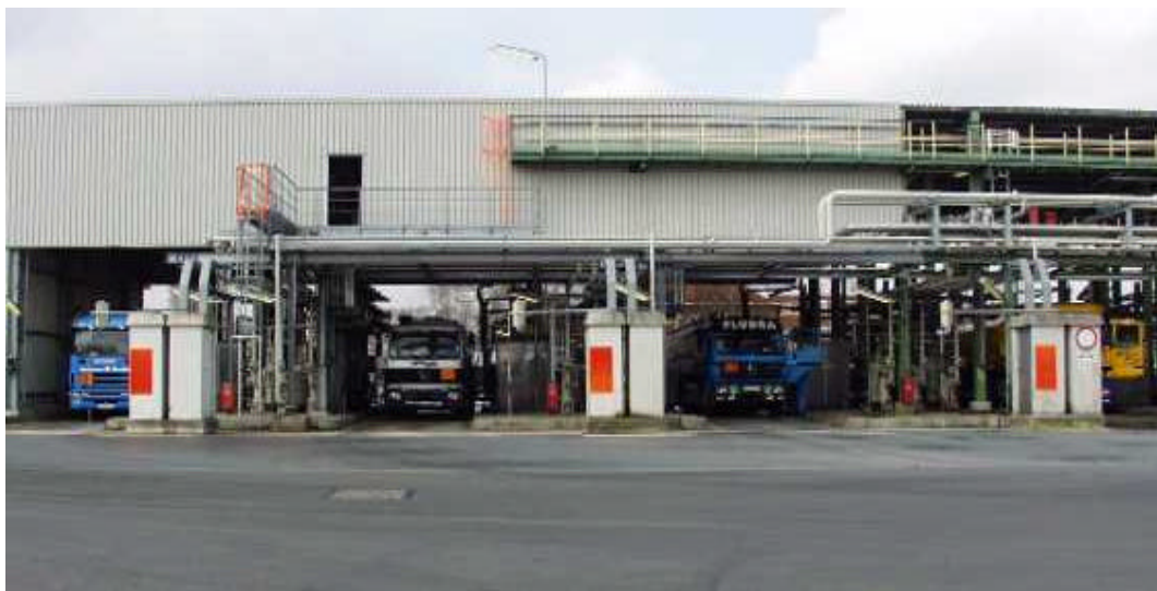
Abb. 10: Bottom loading an der STW

Unsere Zielsetzung für das Jahr 2004 ist, die bisherigen Aktivitäten fortzuführen, um Beeinträchtigungen für Menschen und Umwelt möglichst zu vermeiden.