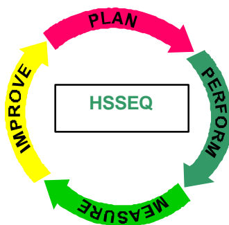
Abb.1: Zyklus zur ständigen Verbesserung

Politik und Grundsätze prägen unsere Aktivitäten und beinhalten den Gesundheitsschutz, die Arbeitssicherheit, den Werkschutz, den Umweltschutz und die Qualitätskontrolle unserer Produkte und Dienstleistungen, basierend auf dem Prinzip der kontinuierlichen Verbesserung. D. h.