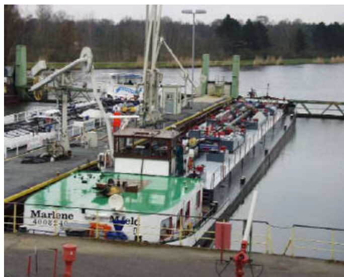
Abb. 11: Schiffsbe- und entladung im Hafen mit geschlossener Olsperre

Studien zur weiteren Reduzierung des Wasserverbrauches und zur Effizienzsteigerung der Abwasseraufbereitung und Abwasserbehandlung sind aufgenommen.