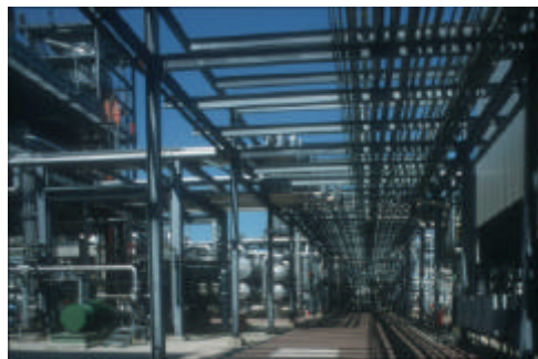
Abb. 3: Blick ins Prozessfeld

Die bei BP Lingen verarbeiteten Rohöle bestehen zu über 98% aus Kohlenwasserstoffen. Rohöl ist ein Gemisch von Kohlenwasserstoffen mit unterschiedlich enthaltenen Anteilen an Sauerstoff-, Stickstoff-, Schwefelverbindungen und Spuren an metallorganischen Verbindungen. Sedimente und Wasser aus Transport und Lagerstätten reichern sich bei der Lagerung im Bodensatz an und werden im Raffinerieprozess entfernt.