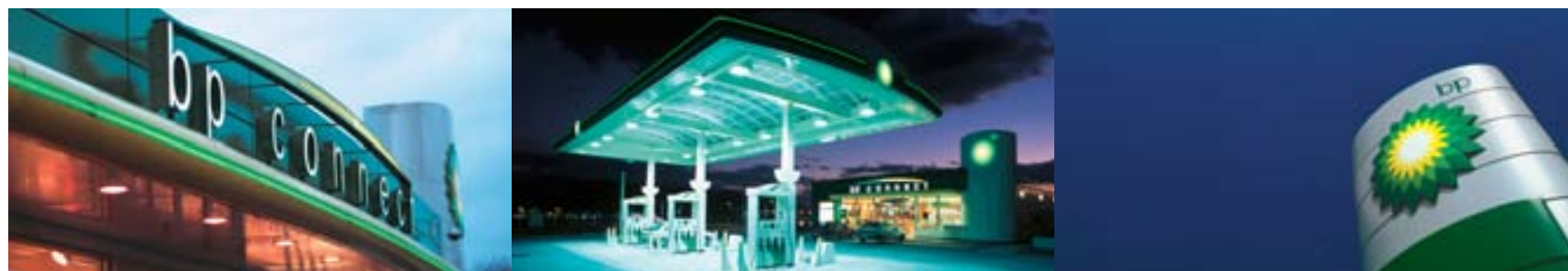
«bp connect»: Mit der Eröffnung von BP Service Affoltern am Albis wurde das erfolgreiche Tankstellenkonzept 2003 ein weiteres Mal umgesetzt.

Um das Credo «Operational Excellence» besser zu leben, verbrachten alle Mitarbeitenden im Tankstellenbereich – und viele andere aus der BP (Switzerland) – zwei Tage auf einer BP Station. Die dort gemachten Erfahrungen lassen sich täglich umsetzen und ermöglichen den Mitarbeitenden, noch kundenfokussierter zu denken und zu handeln.