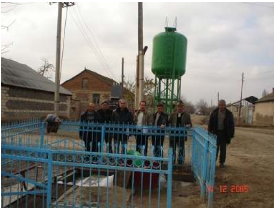
Şəkil 3. Qılıncbəyli icmasında artezian layihəsi