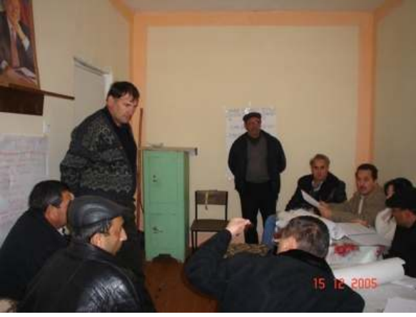
Şəkil 5. Cırdaxan icmasında görüş