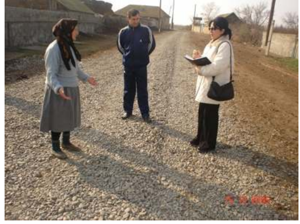
Şəkil 6. Cırdaxan icmasında təmir olunmuş yol