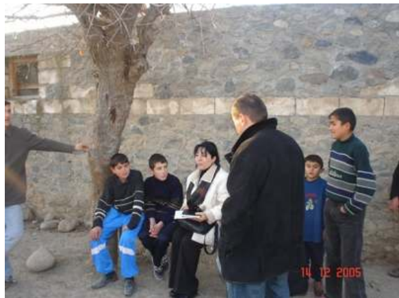
Şəkil 4. Qılıncbəyli icması