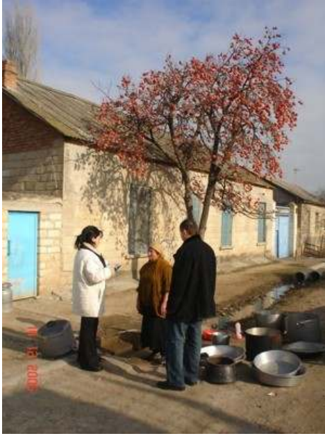
Şəkil 1. Məşədi Hüseynli icması