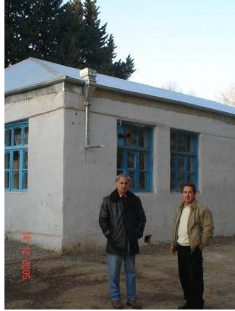
Şəkil 2. Məşədi Hüseynli icmasında məktəb damının təmiri