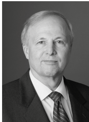
Bob Dudley Group Chief Executive