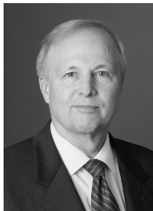
ボブ・ダッドリー グループ最高経営責任者