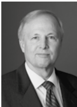
Bob Dudley Group Chief Executive