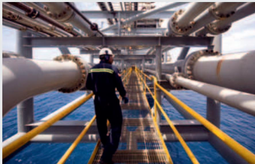
Платформа Cassia, Тринидад

Мы стремимся упростить наш бизнес, сосредоточив внимание на тех областях, где мы обладаем конкурентным преимуществом. Наши сильные стороны – геологоразведка, работа в глубоководных бассейнах, управление разработкой крупных месторождений, газовый бизнес и переработка мирового класса. Технологии и способность выстраивать долгосрочные взаимоотношения служат им дополнением. Хорошие финансовые показатели необходимы для осуществления инвестиций в добычу столь нужных миру энергоносителей, а также для выплат вознаграждения нашим акционерам. Поставляя миру энергию, мы поддерживаем экономическое развитие и способствуем повышению качества жизни миллионов людей. Наша деятельность создает рабочие места, обеспечивает инвестиции, доходы правительств и местных сообществ, способствует развитию инфраструктуры. Портфель активов компании включает проекты с низким уровнем выбросов, которые обладают хорошим потенциалом сейчас и в перспективе.