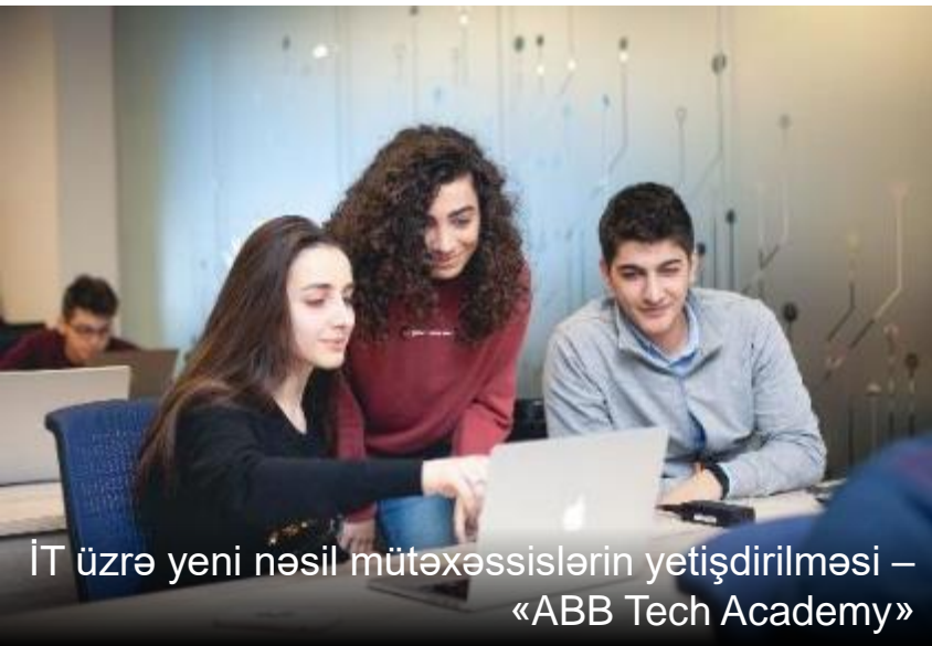
İT üzrə yeni nəsil mütəxəssislərin yetişdirilməsi – «ABB Tech Academy»