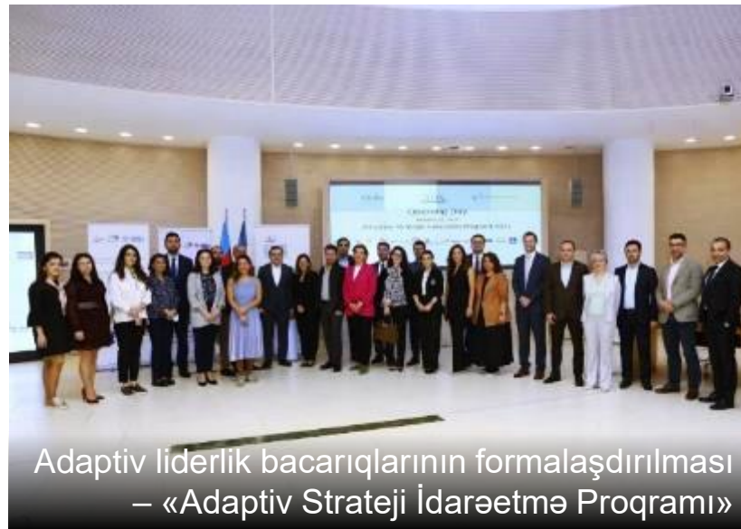
Adaptiv liderlik bacarıqlarının formalaşdırılması – «Adaptiv Strateji İdarəetmə Proqramı»