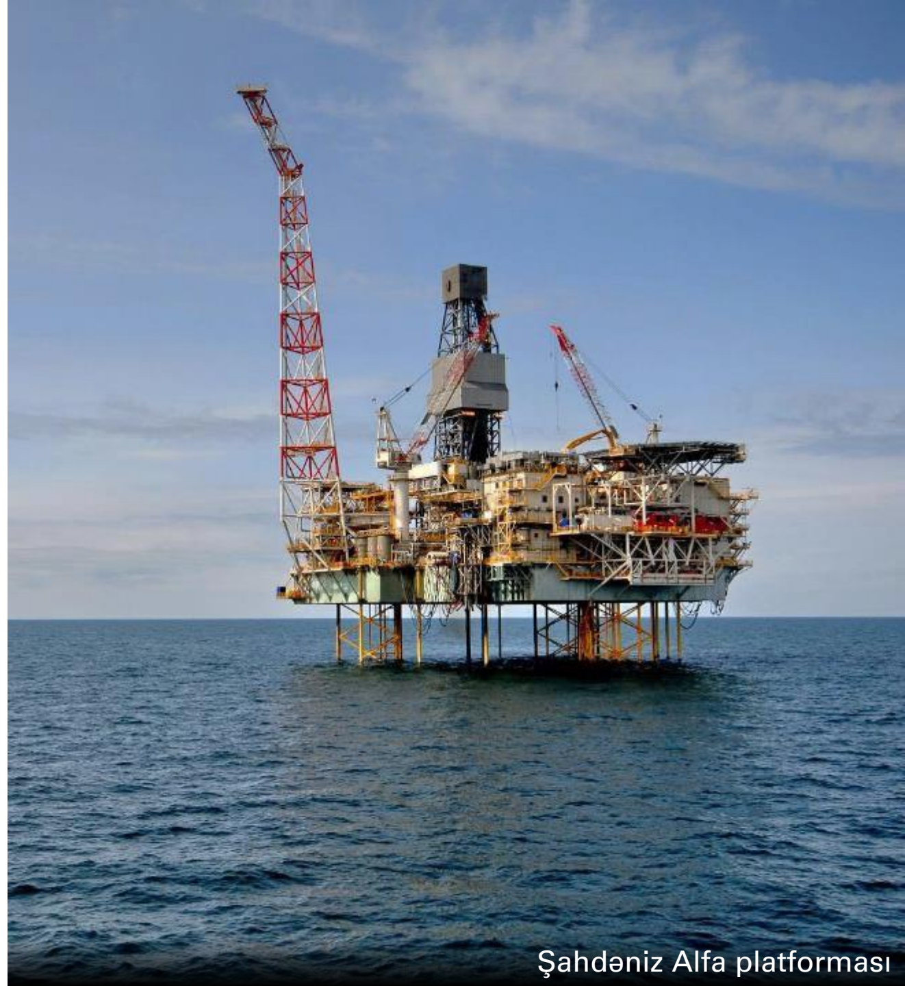
Şahdəniz Alfa platforması