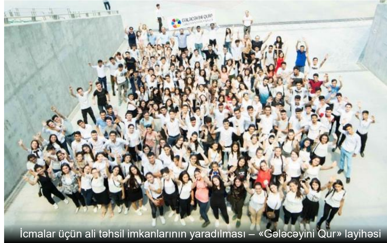
İcmalar üçün ali təhsil imkanlarının yaradılması – «Gələcəyini Qur» layihəsi