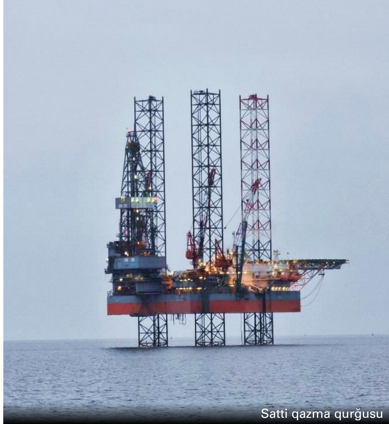
Satti qazma qurğusu