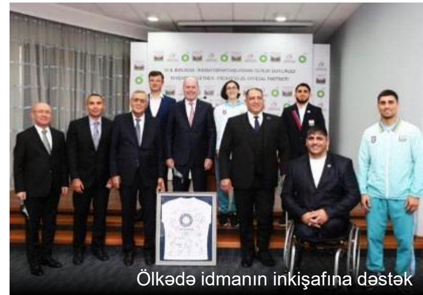
Ölkədə idmanın inkişafına dəstək