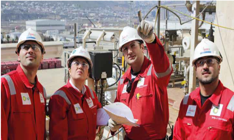
Azərbaycanda ixtisaslı daimi işçilər (%)