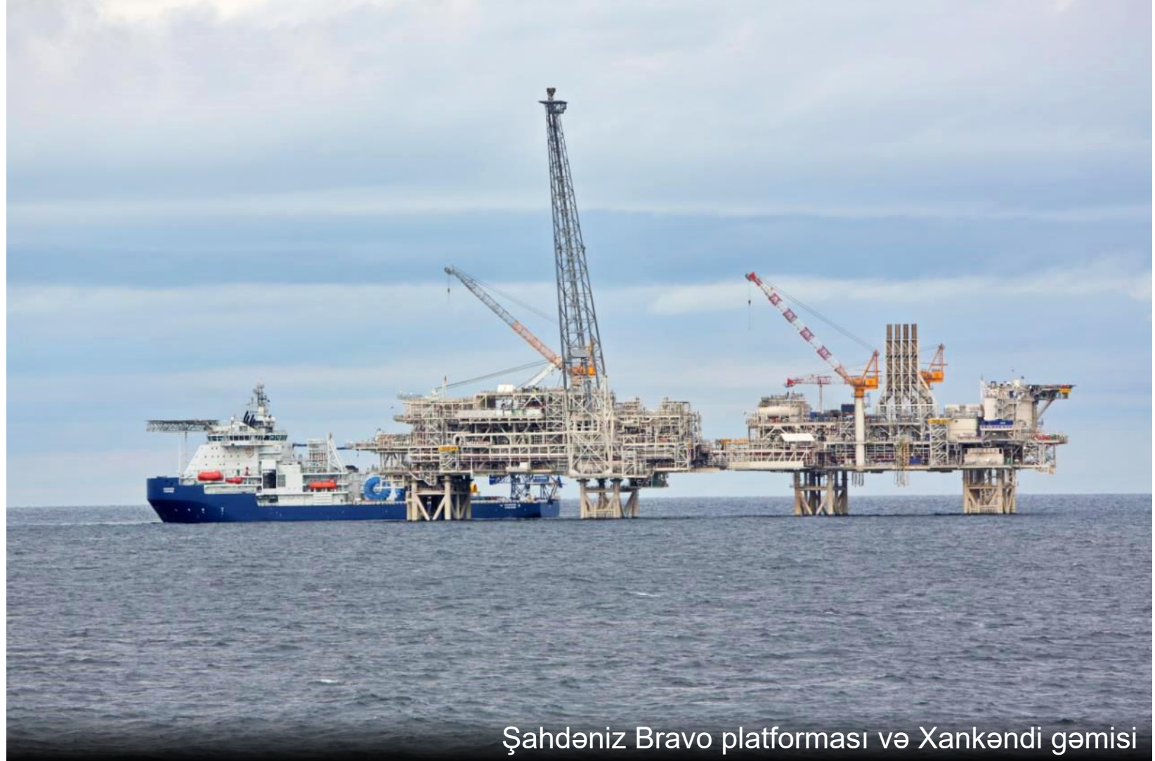
Şahdəniz Bravo platforması və Xankəndi gəmisi