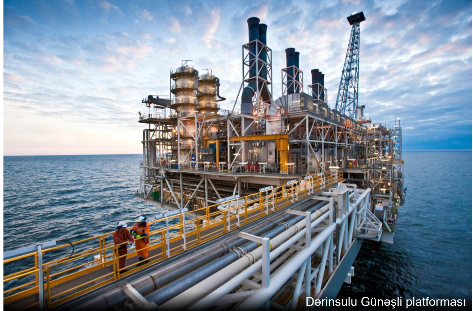
Dərinsulu Günəşli platforması