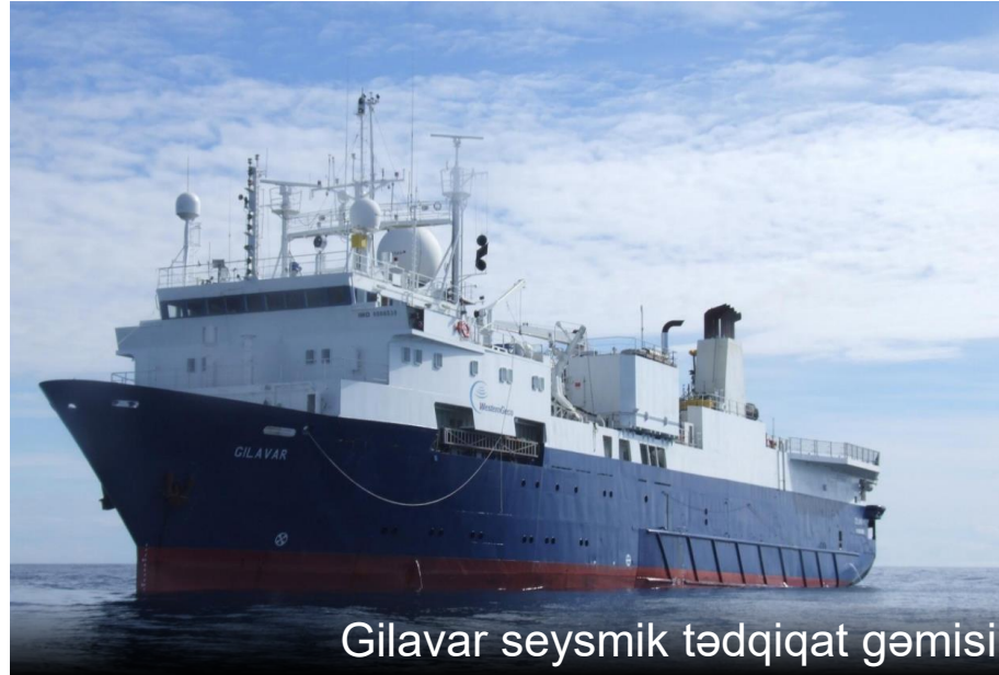
Gilavar seysmik tədqiqat gəmisi