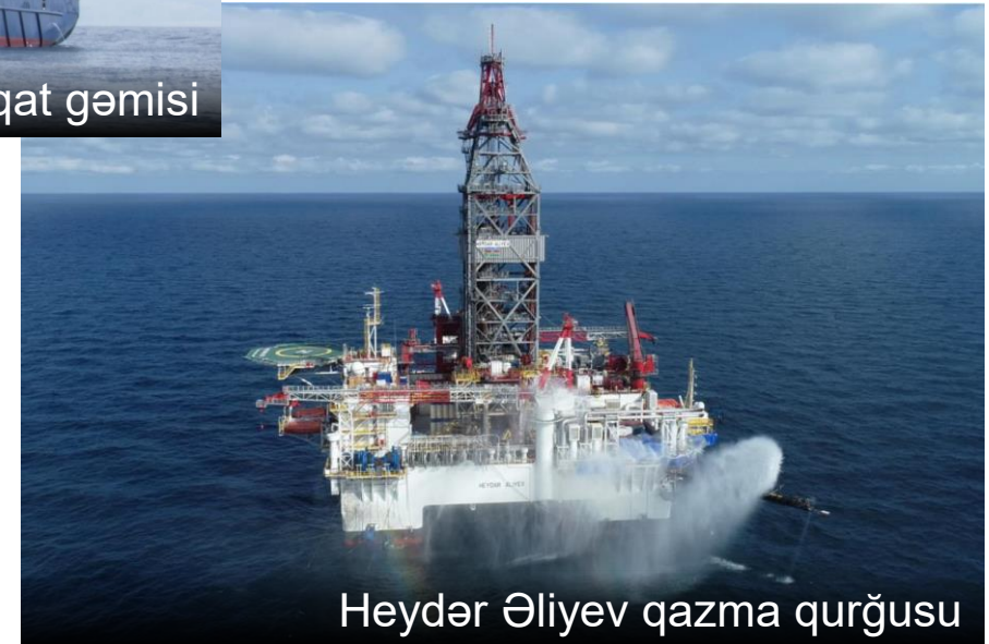
Heydər Əliyev qazma qurğusu