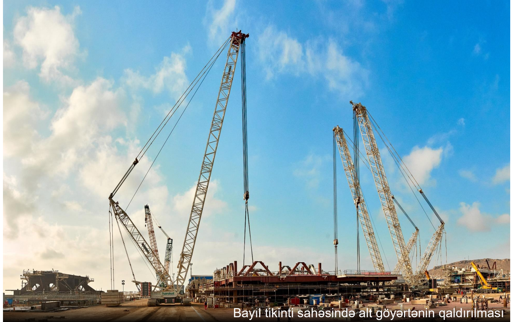
Bayıl tikinti sahəsində alt göyertənin qaldırılması