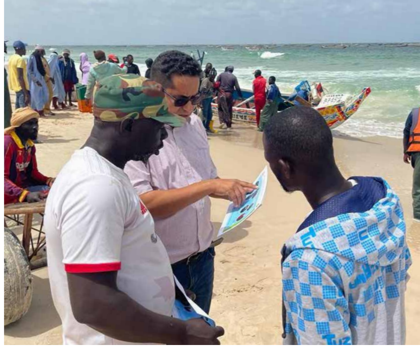
أنشطة التواصل مع الصيادين في سانت لويس وانجاغو