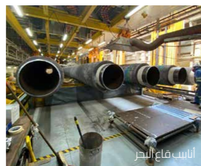
أنابيب قاع البحر

وصل الفريق المشرف على أشغال تحت سطح البحر إلى مرحلة بالغة الأهمية، حيث أطلق عملية تثبيت المعدات المكونة للبنية التحتية لقاع البحر، بما في ذلك الأنابيب والكابلات، باستخدام أسطول من السفن. وستربط هذه البنية بين جميع مكونات المشروع ولا سيما الآبار والمنصة العائمة للإنتاج والتخزين والتفريغ FPSO والمحطة المركزية.