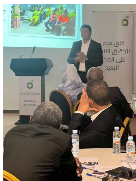
مشاركون في ورشة عمل حول تطوير قدرات القوى العاملة

في يوليو، عقدنا ورشة عمل حول تطوير قدرات القوى العاملة في موريتانيا، بمشاركة أعضاء من الحكومة والشركاء وأكاديميين وممثلين عن القطاع الخاص. وكانت هذه الورشة فرصة رائعة للمشاركة مع فاعلين ملازمين بتطوير قدرات القوى العاملة في المنطقة. وقد مكنتنا الجلسات من مراجعة إنجازاتنا فيما يخص التزام شركة bp بتطوير قدرات القوى العاملة خلال المرحلة الأولى من مشروع تورنتو أحميم الكبير. كما تضمنت المناقشات حقوق العمال ورعاية مصالح القوى العاملة وتنمية المهارات. وكانت النتيجة الرئيسية من هذه النقاشات والمشاركات هي الحصول على آراء متنوعة عن أولويات وخطط تطوير القوى العاملة للمحتوى المحلي للشركة في الفترة من 2023 إلى 2025. وسيتم تنظيم نفس النشاط في السنغال قبل نهاية السنة. تابعونا!