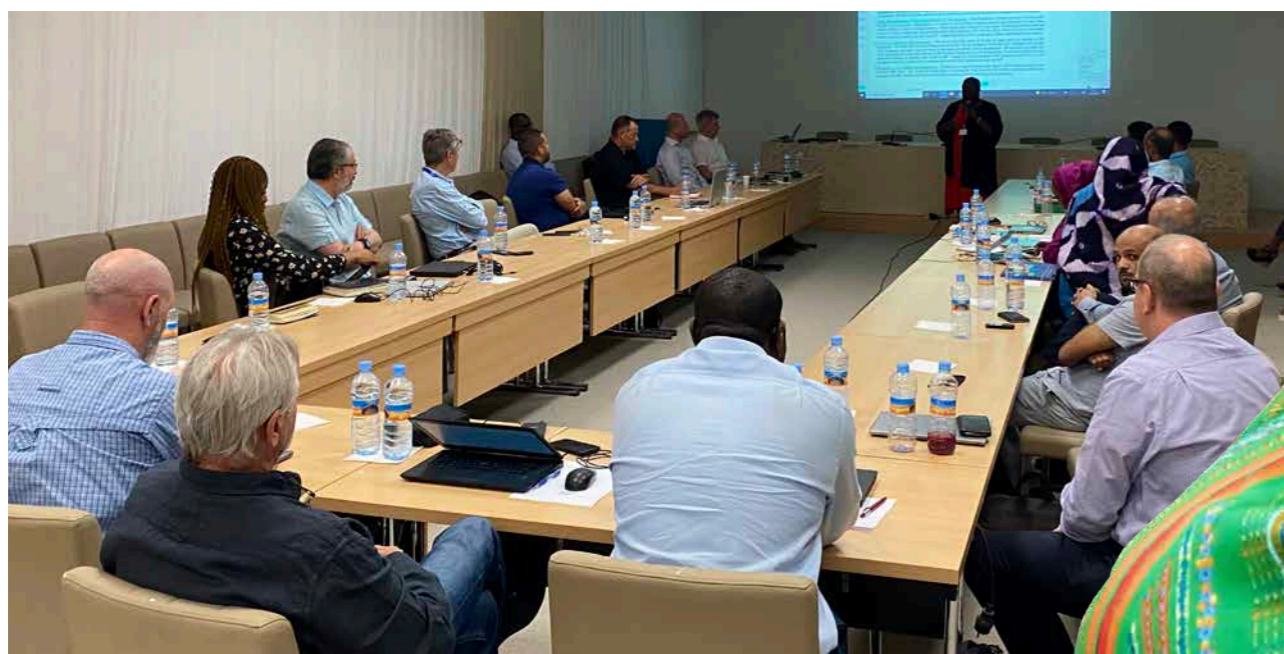
ورشة تحسيسية للموردين المحليين