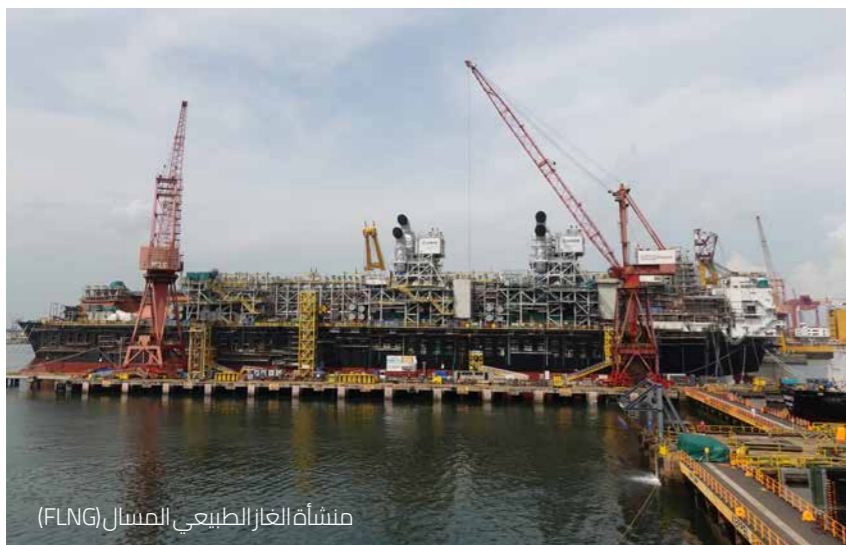
منشأة الغاز الطبيعي المسال (FLNG)