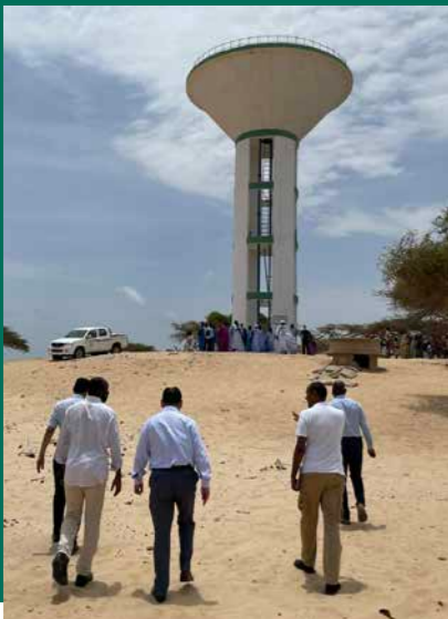
مشروع المياه في انجاغو

“أتقدم بشكر خاص لفريقنا الذي يعمل بلا كلل لتحويل رؤية استثماراتنا الاجتماعية إلى فوائد ملموسة ساهمت في إحداث تغيير في المجتمعات المحلية. وشكراً أيضاً لشركائنا والمجتمعات المحلية في سانت لويس وانجاغو على استضافة شركة bp وعلى حسن التعاون.”