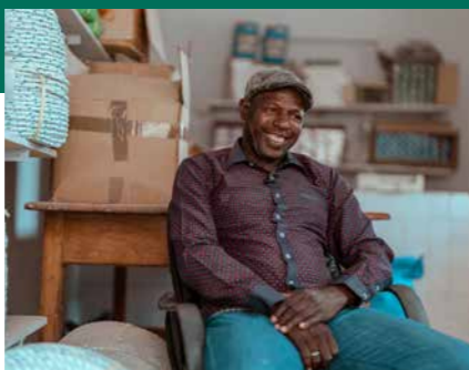
أنشطة التنمية الاقتصادية في سانت لويس