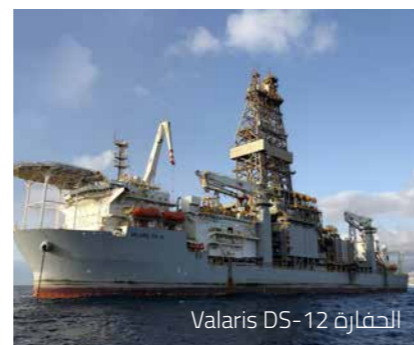
الحفارة Valaris DS-12

تتوفر سفينة الحفر على جميع صمامات قاع البحر الجاهزة للتثبيت. وقد تم حفر وتركيب صمامات البئر الأول (GTA-A01) بالكامل، كما