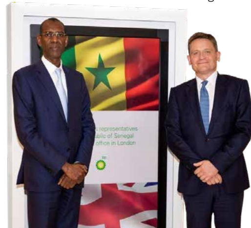
غوردون بيرل (يمين) والوزير عبد الله داودا جالو (يسار) في مقر شركة bp.

وتطرق النقاش لأهمية مشروع تورنتو أحميم الكبير في التنمية الاقتصادية للبلاد وفرص الاستثمار في المستقبل، كما ناقشت المجموعة الأهمية الاستراتيجية لتنمية وتطوير الغاز في السنغال، بما في ذلك من خلال مشروع الغاز الوطني لتوليد الكهرباء، ياكار ترانغا / Yaakar Teranga.