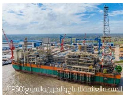
المنصة العائمة للإنتاج والتخزين والتفريغ (FPSO)

اكتمال تركيب نظام إرساء FPSO بوضع ركائز وسلاسل الإرساء بأمان في مكانها.