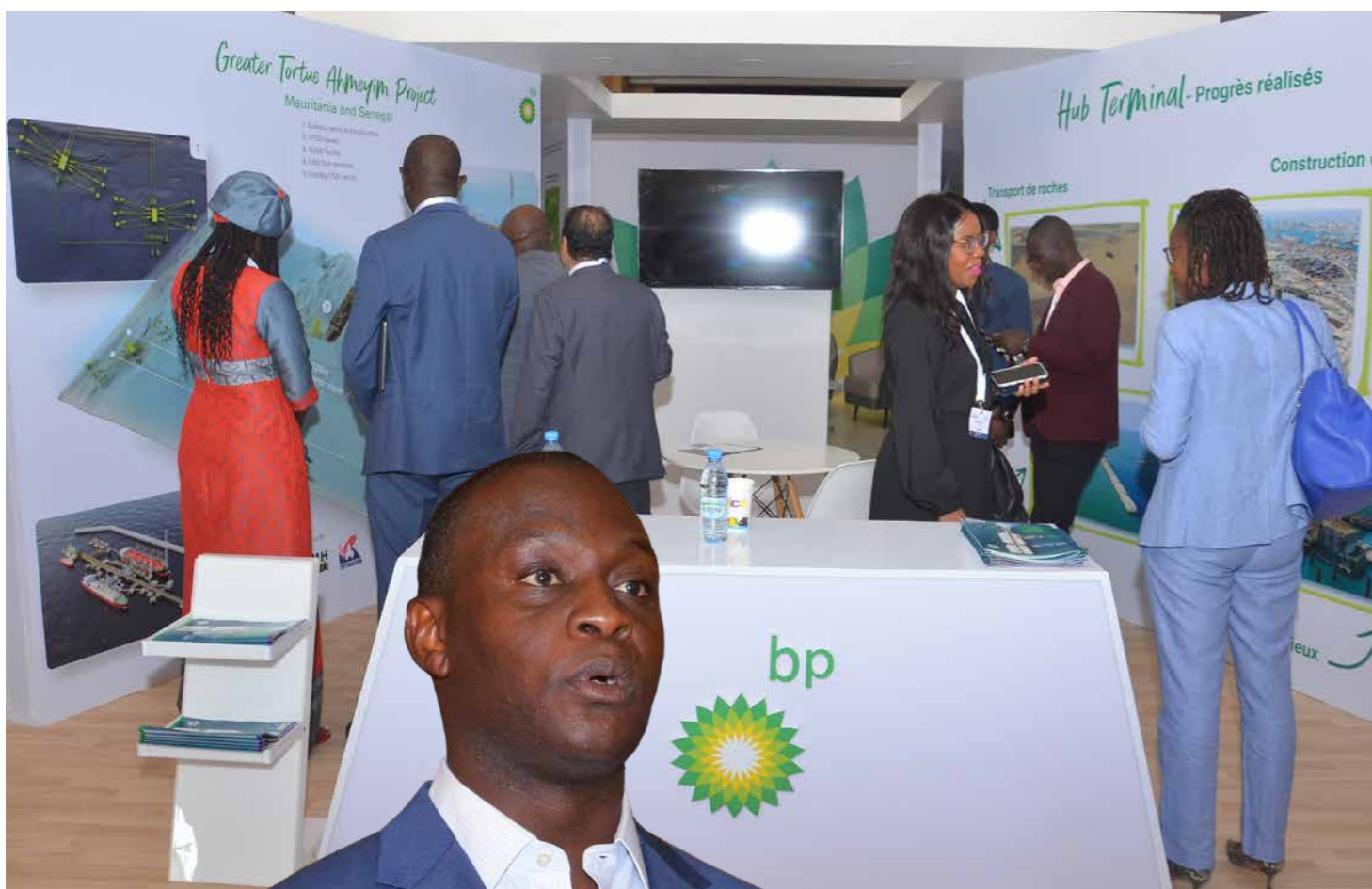
جناح شركة bp في مؤتمر MSGBC

وقد كانت فرصة رائعة للتواصل مع الفاعلين والجهات المعنية ومواكبة الأخبار في منطقة حوض السنغال. استهلت هذه الفعالية بيوم مخصص للمحتوى المحلي، حيث تطرقنا إلى التزامنا بالمحتوى المحلي من خلال تنمية الشركات والمقاولات المحلية.