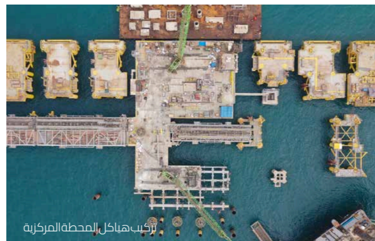
تركيب هياكل المحطة المركزية

شاهد هذا الفيديو القصر لمعرفة المزيد عن المشروع