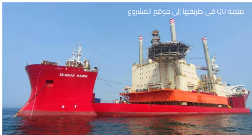
منصة QU في طريقها إلى موقع المشروع

أكملت منصة المرافق والوحدات السكنية رطنتها بمسافة 12000 ميل بحري تقريبا (19300 كيلومتر) من بانثاي في الصين إلى موقع المشروع البحري في موريتانيا والسنغال.