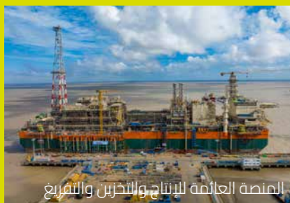
المنصة العائمة للإنتاج والتخزين والتفريغ

احتفلت فرق العمل في ساحة بناء السفن COSCO في تشيدونغ، باستكمال 10 ملايين ساعة عمل دون حوادث في بناء FPSO.