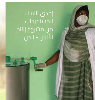
إحدى النساء المستفيدات من مشروع إنتاج الألبان - إبدن